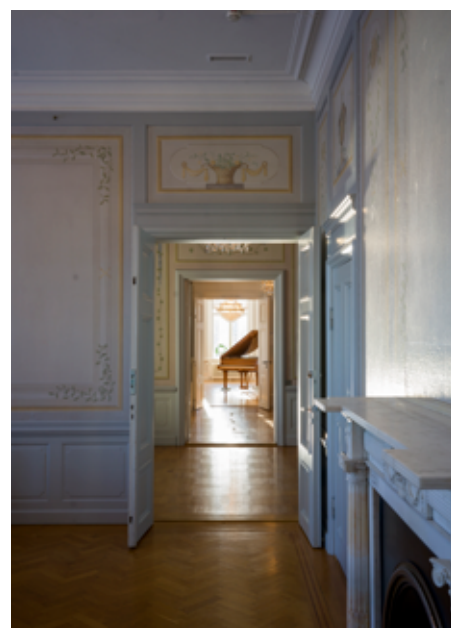
Kika in i Jonsereds herrgård! Se fler bilder från interiören på partillebo.se/herrgard

plats som lockar besökare. En ny detaljplan gör det möjligt att utveckla verksamheten. Till exempel ska vägen bli mer framkomlig och säker, och det finns tankar på att renovera den gamla ladugårdsbyggnaden så att den blir plats för allt från hantverk och galleri till smådjursstall och hinderbana. En detaljplan ger också de gamla kulturhistoriska byggnaderna ett skydd mot rivning och förvanskning.