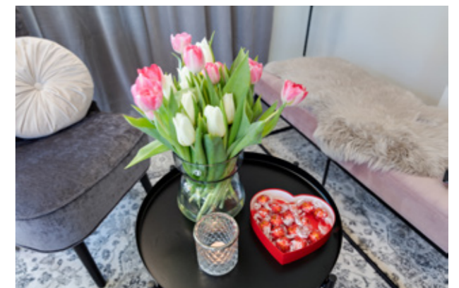
Rogivande musik och mjuka kuddar.

Hon uppmanar verkligen till fysisk aktivitet och vill få alla att inse att insidan är minst lika viktig som utsidan.