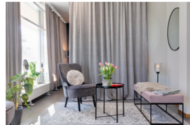
Inredningen går i sobert grått med puderrosa detaljer.

– För mig är det optimalt att kunna kombinera det sjuka med det friska. Och allra viktigast är mötet med människor. Här på kliniken har jag mycket större möjlighet att sitta ner och prata, i lugn och ro, med mina klienter.