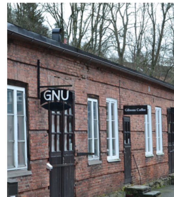
En ny generation företagare har flyttat in.