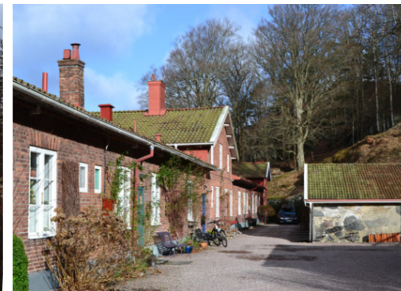
De unika tegellängorna med tillhörande trädgårdar.