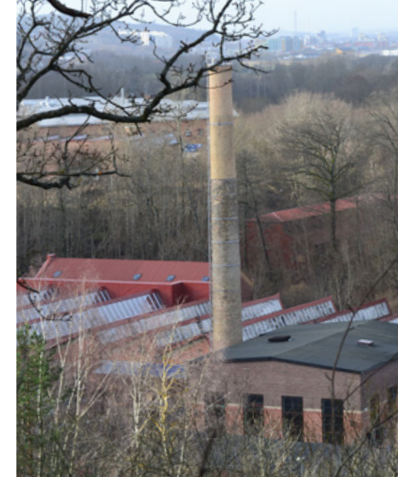
Vy över delar av fabriksområdet.

Text Louise Lagerkvist Olemyr