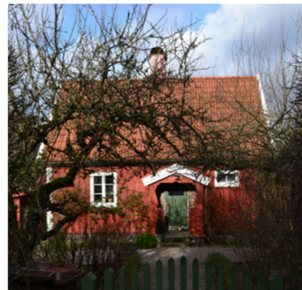
Nationalromantiskt hus i Hallebacken.