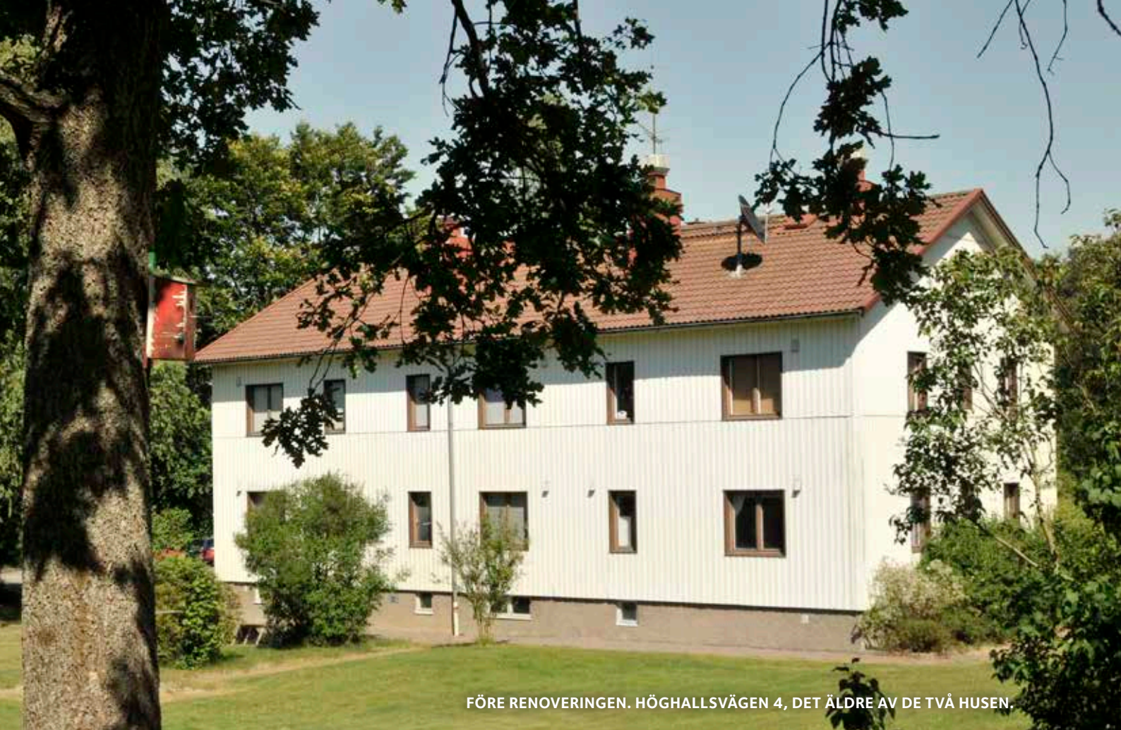
FÖRE RENOVERINGEN. HÖGHALLSVÄGEN 4, DET ÄLDRE AV DE TVÅ HUSEN.