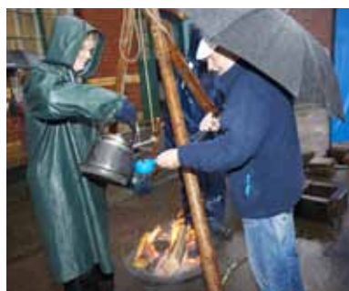
Utanför ingången serverades kaffe.