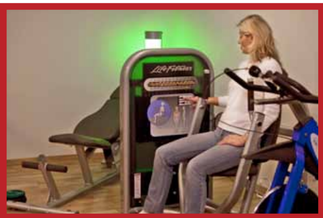
Cirkelgymmet är den senaste nyheten.

– Man kan inte tro att där receptionen ligger var det för inte så länge sedan en gågata, säger hon. Vi är väldigt glada att vi fått den här möjligheten.