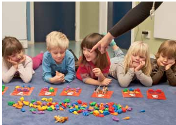
Barnen leker matte.