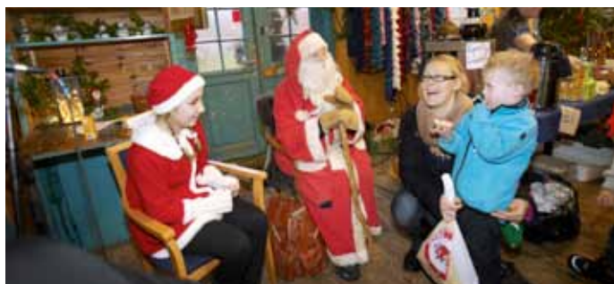
Tomten gladdade barnen på Jul i Jonsered.

Den 3 december arrangerades Jul i Jonsered, den stora traditionella julmarknaden med design och hantverk, tomteverkstad, föredrag, lotterier, kafé och julmys. Arrangörer var Jonsereds hembygdsförening tillsammans med Partille kommun och ett stort antal lokala aktörer och företagare.