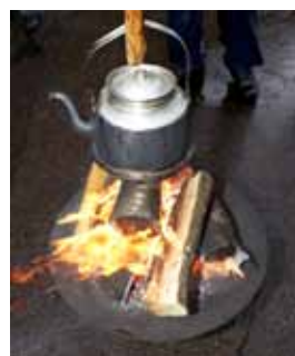
Kaffet värms av elden.