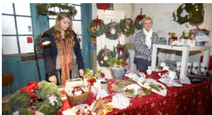
Julkransar och andra juldekorationer fanns till försäljning.

NÄR NU 2011 NÄRMAR SIG sitt slut så kan jag konstatera att samtidigt som ett år går fort så händer det också mycket.