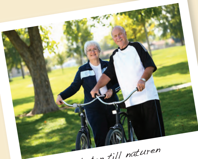
Närheten till naturen