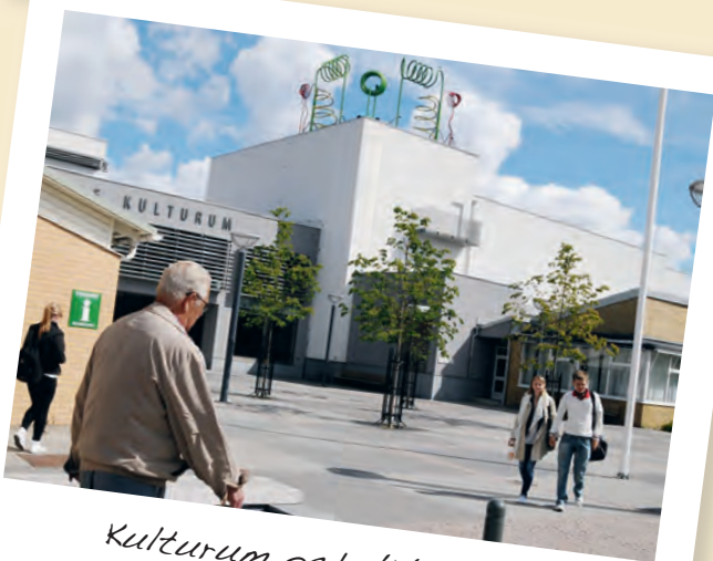
Kulturum och biblioteket