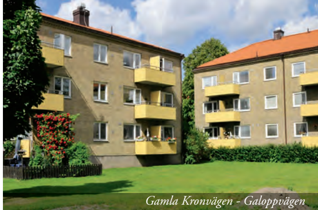
Gamla Kronvägen - Galoppvägen