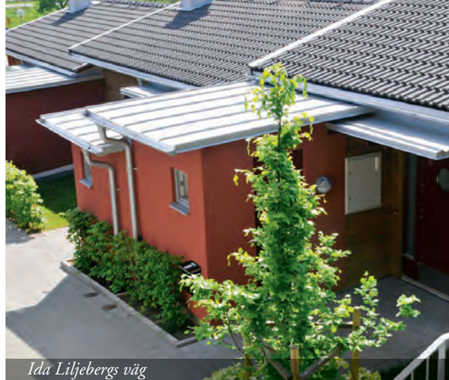
Ida Liljebergs väg

Ida Liljebergs väg, elva stycken hyresrätter med radhuskänsla i Mellby, byggdes 2006. En gammal bevarad stenmur mitt bland husen liksom markens nivåskillnader ger hela området en trivsamt och personlig karaktär. Området är granne med villor och radhus och med orörd natur direkt bakom ryggen. Lägenheterna är byggda i ett, alternativt två plan samt i suterräng. Alla har egen uteplats. En del har även balkong. Planlösningarna är öppna och är enligt Partillebos standard för nybyggnation, vilket bl. a. innebär tillgänglighetsanpassat, kaklade badrum och egen tvättmaskin. Området består av 3 st. 2 r o k, 2 st. 3 r o k och 6 st. 4 r o k och ytorna varierar från 63 till 96 kvm.